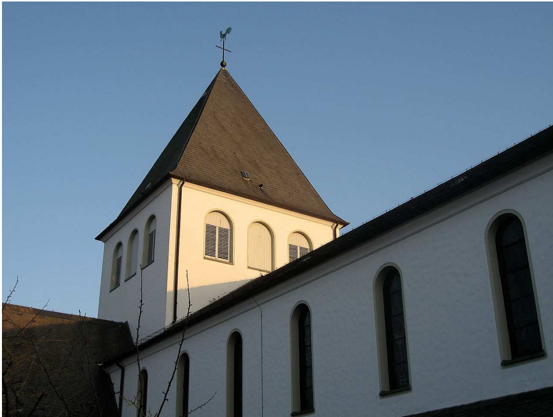
Die 1952/53 erbaute Pfarrkirche Mariä Himmelfahrt in Meschede.