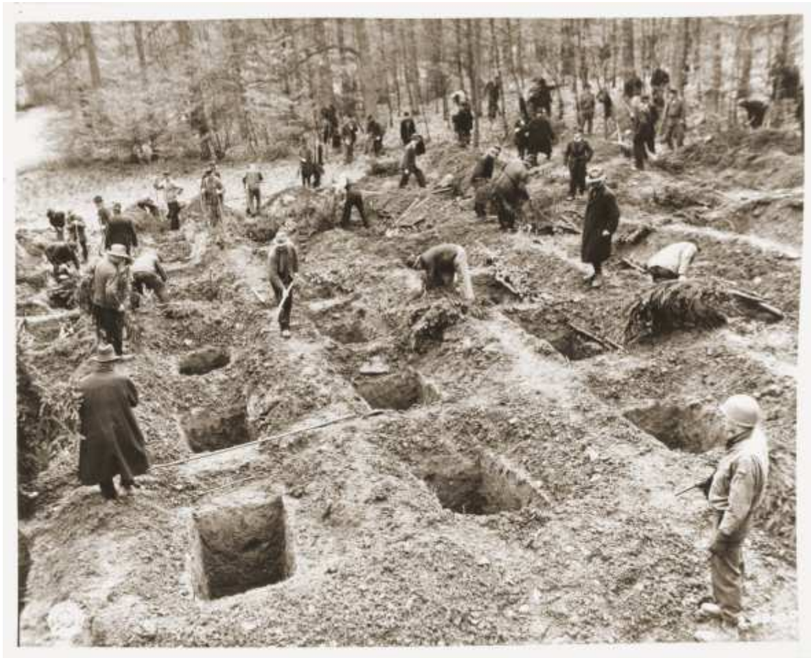
Sauerländische Zivilisten heben Einzelgräber aus für die am 3.5.1945 im Suttroper Massengrab aufgefundenen 57 ermordeten Menschen aus der Sowjetunion.

notstand“ hat das Gericht nicht erkennen können. Miesel hätte im Gegenteil die Pflicht gehabt, Kammler auf die Unrechtmäßigkeit hinzuweisen, sich mit den anderen Offizieren zu beraten oder Meldung bei vorgesetzten Behörden zu machen. Miesel legte dagegen erneut Revision beim BGH ein. Dieser hat die Revision allerdings im Dezember 1961 verworfen. 99