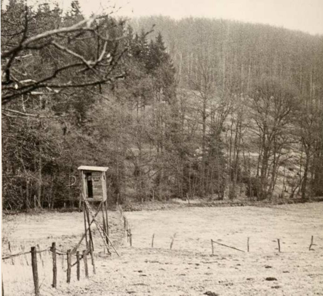
Ein Wiesengrund zwischen Meschede und Eversberg nahe der „Kriegsgräberstätte“: Hier geschah der Mord an 80 polnischen und sowjetischen Zwangsarbeitern.

Bald darauf luden der christdemokratische Bürgermeister Engelbert Dick 109 (1907-1962) und die Stadtverwaltung die ganze Bevölkerung über öffentliche Anschläge zu einer würdigen Beerdigung der Ermordeten auf dem sogenannten „Franzosenfriedhof“ ein: