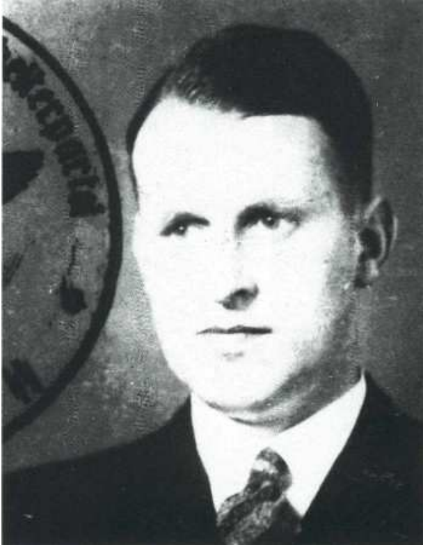
SS-General Hans Kammler, dem die „Division zur Vergeltung“ unterstand.