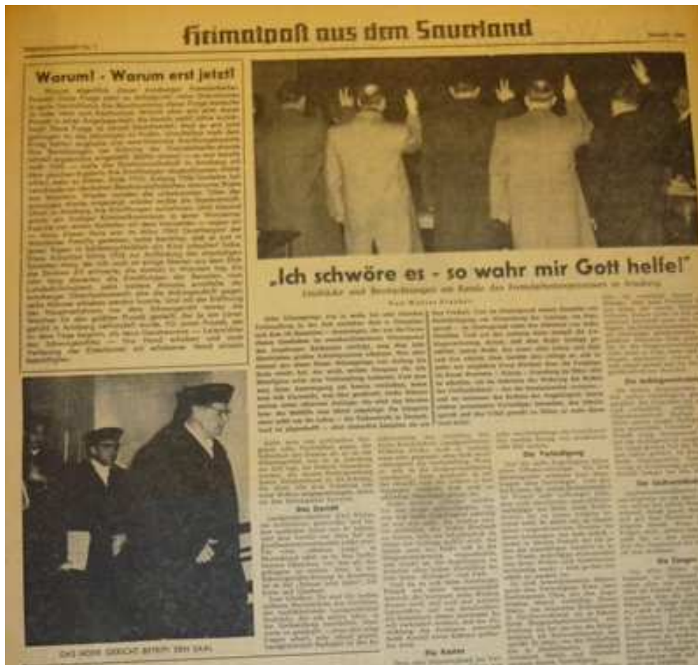
Ausschnitt aus der Westfalenpost vom Neujahrstag 1958.