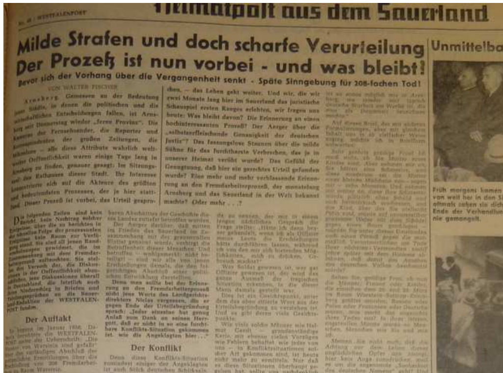
Ausschnitt aus dem Lokalteil der Westfalenpost vom 14. Februar 1958.