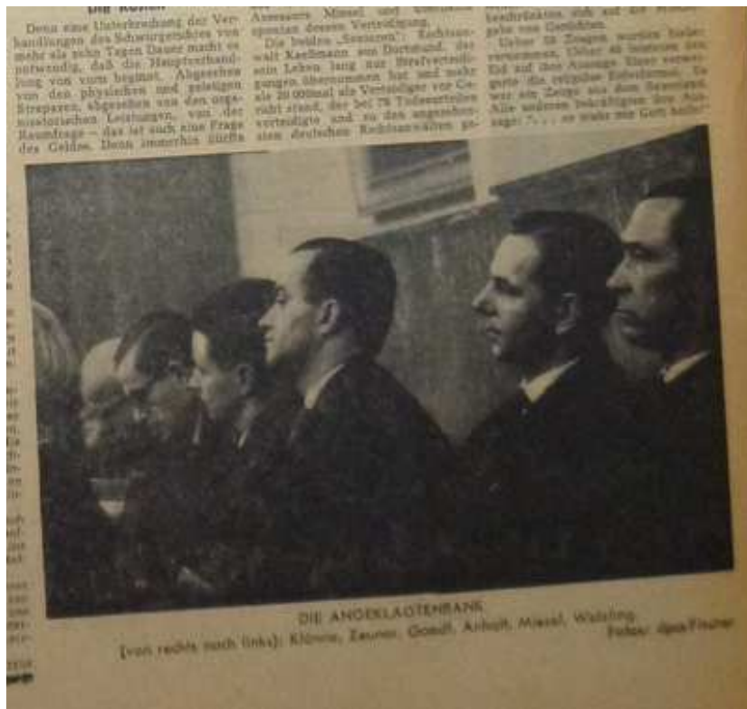
Ausschnitt aus der Westfalenpost vom Neujahrstag 1958.

mit teils unklaren und widersprüchlichen Zeugenaussagen konfrontiert. Auch aus diesem Grund taten sich die Laienrichter schwer, eine harte Bestrafung mit zu tragen. 20