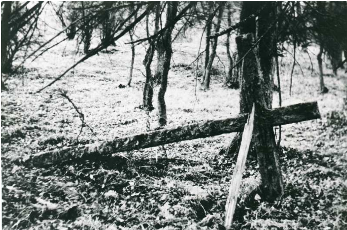
Das „Mescheder Sühnekreuz“ nach seiner Ausgrabung im November 1964 mit den Spuren von Äxten, Feuer, Erdlagerung seit 1947 sowie verwitterter Inschrift.