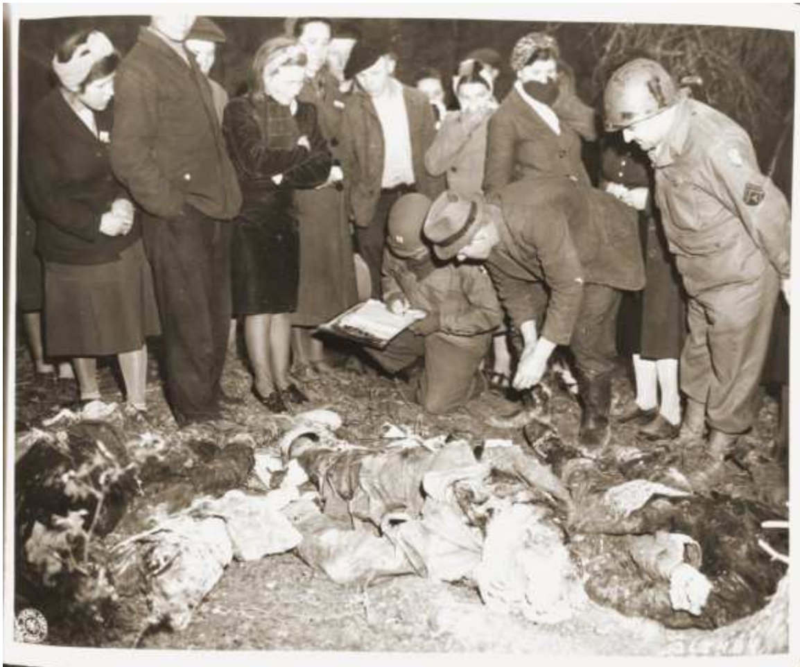
Am Massengrab „russischer“ Zwangsarbeiter“ nahe Suttrops. Ein Captain der US-Army nimmt Informationen zur Identifikation eines Mordopfers auf. Aufnahme vom 3. Mai 1945.

Nicht weiter während des Prozesses verfolgt wurde der Brand der Warsteiner Schützenhalle kurz nach den Mordtaten, weil die staatsanwaltschaftlichen Ermittlungen ergebnislos verlaufen waren. Dennoch liegt es nahe, dass enge Zusammenhänge zu den Morden bestanden. Zwar hatte es Luftalarm gegeben, aber tatsächlich war über Westdeutschland zu dieser Zeit kein alliierter Flugzeug gemeldet worden. Zeugen berichteten, dass die separaten Unterkünfte der französischen Kriegsgefangenen in der Halle nicht verschlossen gewesen waren. Dagegen waren die Unterkünfte der Zwangsarbeiter besonders fest verschlossen worden. Während des Brandes sei die Feuerwehr am Löschen gehindert worden. Die Zwangsarbeiter überlebten nur deswegen, weil die Franzosen eine Trennwand in der Schützenhalle eingerissen hatten. 60