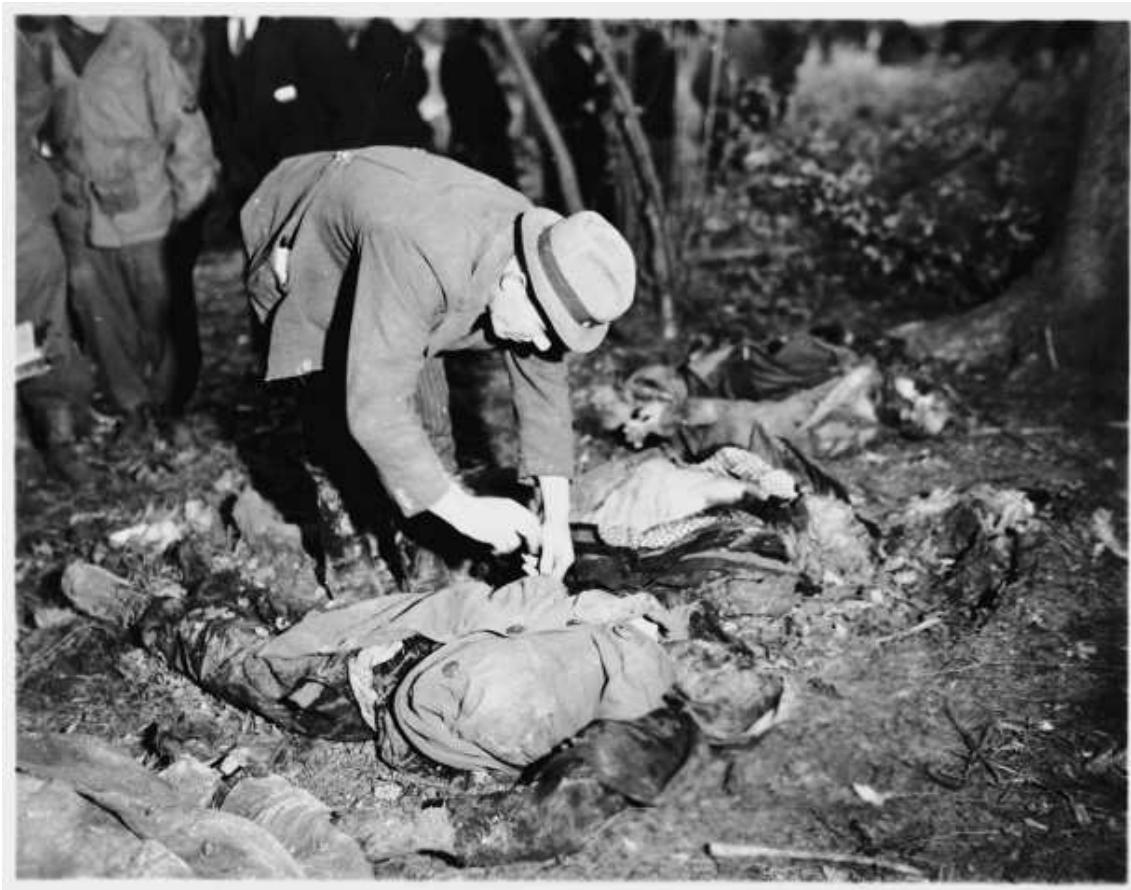
Identifikationsversuch bei einem der 57 am 3. Mai 1945 nahe Suttrop exhumierten Mordopfer.