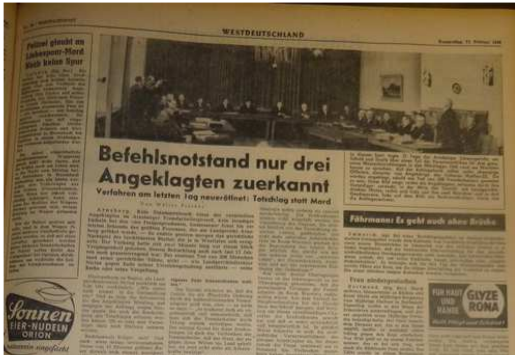
Ausschnitt aus einer überregionalen Seite der Westfalenpost vom 13. Februar 1958.

Befehls Kammlers „ schon objektiv nicht verbrecherisch war “. Ziel sei vielmehr der Schutz der Truppe und der Bevölkerung gewesen. Sollte das Gericht dennoch zu der Auffassung kommen, dass der Befehl verbrecherisch gewesen sei, so hätte Wetzling dies zum damaligen Zeitpunkt nicht erkennen können. Der Anwalt bezweifelte die Zuständigkeit des Gerichts in einer Militärstrafsache, befürchtete, dass aufgrund der Zusammensetzung des Gerichts der Einfluss der Berufsrichter überwiegen würde, und kritisierte die voreingenommene Berichterstattung der Presse. 71