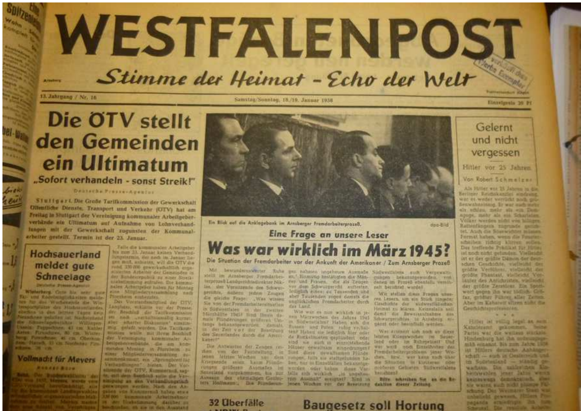
Titelseite der Westfalenpost vom 18./19. Januar 1958.