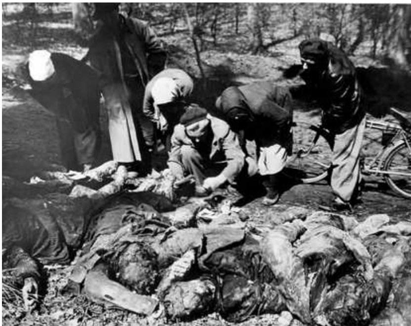
Deutsche Zivilisten suchen auf Weisung der US-Amerikaner nahe Suttrop bei den am 3.5.1945 exhumierten Massenmordopfern nach Identitätspapieren.

71 beziehungsweise 80 Fällen lebenslänglich Zuchthaus sowie Aberkennung der bürgerlichen Ehrenrechte auf Lebenszeit. Für Miesel wurden fünf Jahre Zuchthaus gefordert. Er hätte sich schuldig gemacht, weil er ohne Tatherrschaftswillen den Tötungsbefehl Kammlers weitergegeben habe. Auch für Anhalt waren fünf Jahre Zuchthaus wegen Beihilfe zum Mord vorgesehen, weil er den Mordbefehl innerlich zwar verurteilt, ihn aber dennoch ausgeführt hat. Gaedt hatte zwar ebenfalls Bedenken gegen den Mordbefehl, hat diesen aber dennoch ausgeführt. Auch für ihn wurden fünf Jahre Zuchthaus gefordert. Im Fall Zeuner hat die Staatsanwaltschaft aufgrund mildernder Umstände drei Jahre Gefängnis gefordert. Das Verfahren sollte nach dem Straffreiheitsgesetz von 1954 eingestellt werden. Klönne warf die Staatsanwaltschaft die Förderung der Ausführung des Mordbefehls durch Beihilfe vor. Dem Angeklagten mildernde Umstände zu gewähren, hielt die Staatsanwaltschaft nicht für gegeben, hat er sich doch freiwillig an den Taten beteiligt. Wie für die meisten anderen Angeklagten sah die Staatsanwaltschaft auch für Klönne fünf Jahre Zuchthaus vor. 67