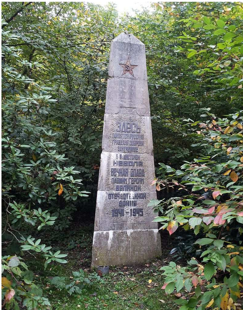
Sowjetische Stele, heute auf dem Waldfriedhof Fulmecke in Meschede.

durch die Amerikaner mit sechs Güterwagen der Front entgegengefahren und dort freigelassen. Die Amerikaner haben sie zeitweise in einer Kaserne in Lippstadt interniert. Kurz nach der Besetzung Warsteins am 7.4.1945 erfuhr der amerikanische Kommandant von der Mordaktion im Langenbachtal. Zeitweise plante dieser, die Stadt für 24 Stunden zur Plünderung, wohl durch Zwangsarbeiter, freizugeben. Dazu kam es nicht, weil die Einwohner glaubhaft machen konnten, dass die Warsteiner nichts mit den Taten zu tun hatten. Zur Exhumierung der Leichen wurden ehemalige Mitglieder der NSDAP verpflichtet. Die Warsteiner Bevölkerung hatte an den Toten vorbeizuziehen. Anschließend wurden die Opfer würdig beigesetzt. Ganz ähnlich verliefen die Ereignisse in Suttrop. Auch dort hatten frühere Parteigenossen das Massengrab zu öffnen, und die Bevölkerung des Ortes und umliegender kleiner Dörfer musste an den Leichen vorbeifilieren, ehe diese in Einzelgräber beigesetzt wurden. Später wurden an beiden Orten auf russische Initiative Denkmäler errichtet. Diese trugen in englischer, russischer und deutscher Sprache die Inschrift: „Hier ruhen russische [?] Bürger bestialisch hingemordet in faschistischer Gefangenschaft. Ewiger Ruhm den gefallenen Helden des grossen vaterländischen Krieges 1941-1945.“ 6