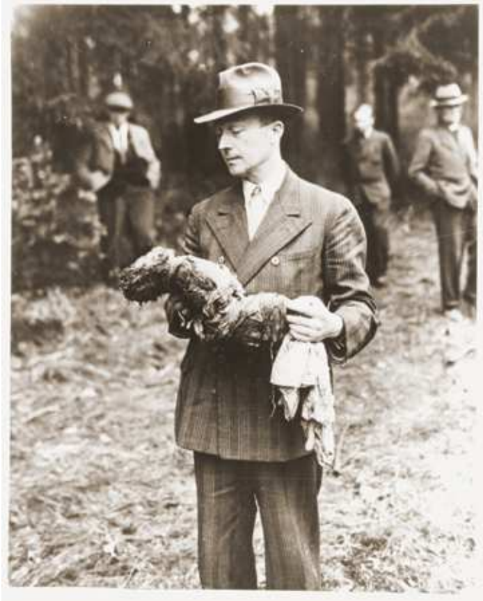
Ein deutscher Zivilist hält den im Massengrab bei Suttrop am 3. Mai 1945 ausgegrabenen toten Säugling in den Händen.