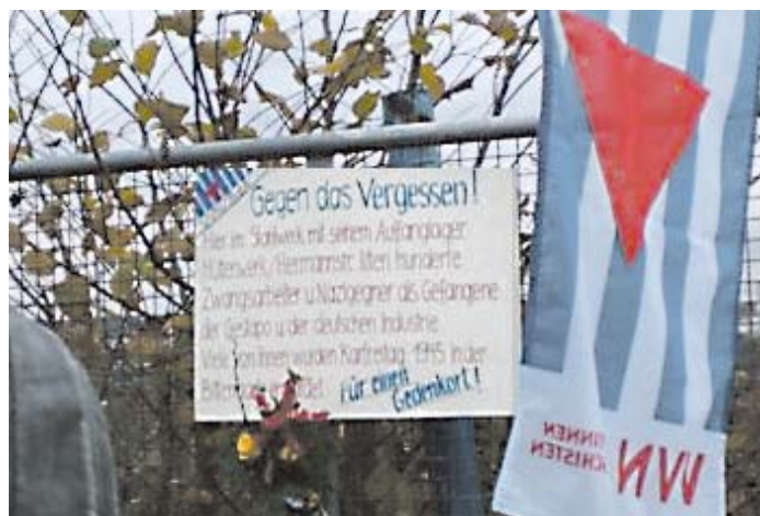
Eine Aktion am Zaun des ehem. Stahlwerkes - jetzt Phönixsee. Gegen Vöglar, Vereinigte Stahlwerke in Dortmund-Hörde.

Dabei kamen neben den deutschen Beschäftigten, so Dr. Ralf