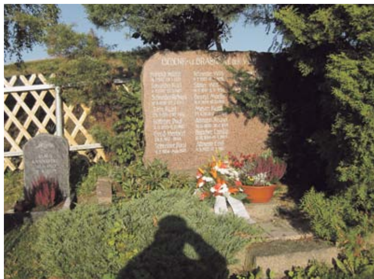
Auf dem Crottendorfer Friedhof

»Gegen das Vergessen«, so heißt ein Projekt, das vom Kreisverband Annaberg der Vereinigung der Verfolgten des Naziregimes-Bund der Antifaschisten ins Leben gerufen wurde. Unser Ziel ist es, jungen Menschen in Gesprächen mit Zeitzeugen dem dunkelsten Teil deutscher Geschichte näherzubringen.