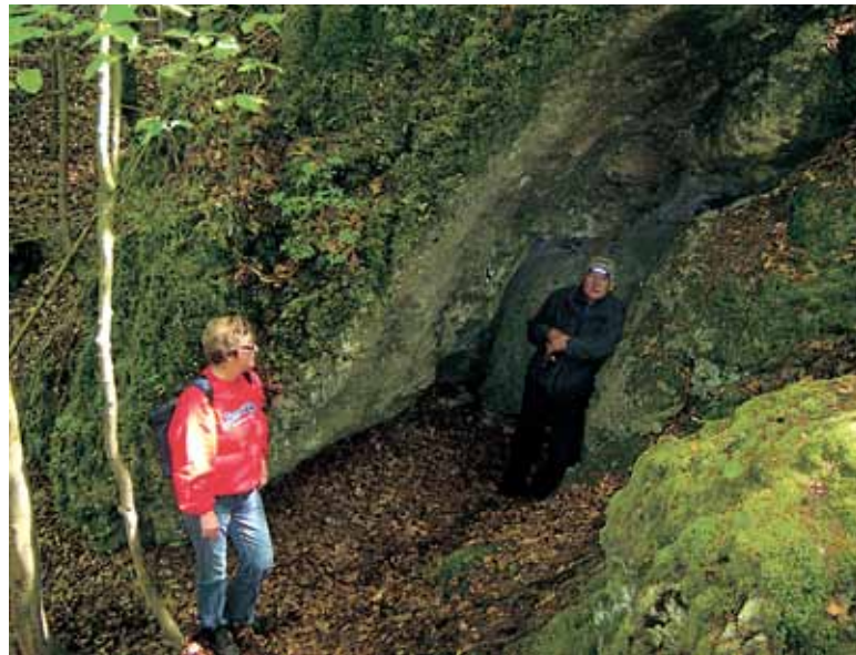
Am Einstieg in die »Druckerhöhle«

Nach seiner Rückkehr arbeitete Ludwig in der Nürnberger Betreuungsstelle für rassistisch und politisch Verfolgte. Er gehörte zu den Gründungsmitgliedern der VVN und