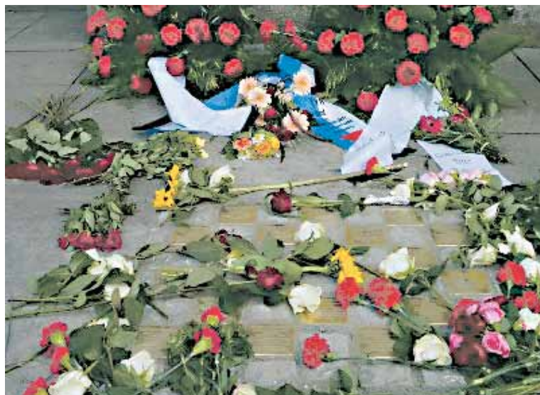
20 Stolpersteine zur Ehrung ermordeter Hamburger Bürgerschaftsabgeordneter

Am 8. Juni wurden vor dem Hamburger Rathaus in Anwesenheit des Künstlers Gunter Demnig 20 Stolpersteine für die Hamburger Bürgerschaftsabgeordneten eingeweiht, die Opfer des Faschismus wurden. Die Hamburger Bürgerschaft hatte die Patenschaft für die Stolpersteine übernommen. Ärgerlich war nur, dass in den meisten Reden und in der aus diesem Anlass erschienenen Broschüre der Faschismus nicht beim Namen genannt wurde. Statt dessen sprach man von »Opfern totalitärer Verfolgung«. Gut, dass die zwanzig Toten sich das nicht mehr anhören konnten. hjm