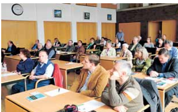
Die dritte Tagung zur Regionalgeschichte im Ludwigsluster Landratsamt war gut besucht. Länderredaktion: Max Ragwitz, Hagenow

Forschungen zu den KZ-Außenlagern Düssel und Garlitz. Er verdeutlichte sehr anschaulich, dass neben akribischer Forschungsarbeit auch ein Quentchen Forschungsglück dazu gehört, um Geschichte erlebbar