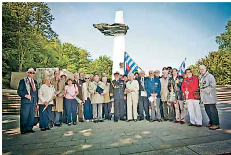
Die Delegation der polnischen Kombattantinnen und Kombattanten gemeinsam mit Kameradinnen und Kameraden der Berliner VVN-BdA vor dem Denkmal des polnischen Soldaten und deutschen Antifaschisten im Anschluss an die Kranzniederlegung am 8. Mai 2012