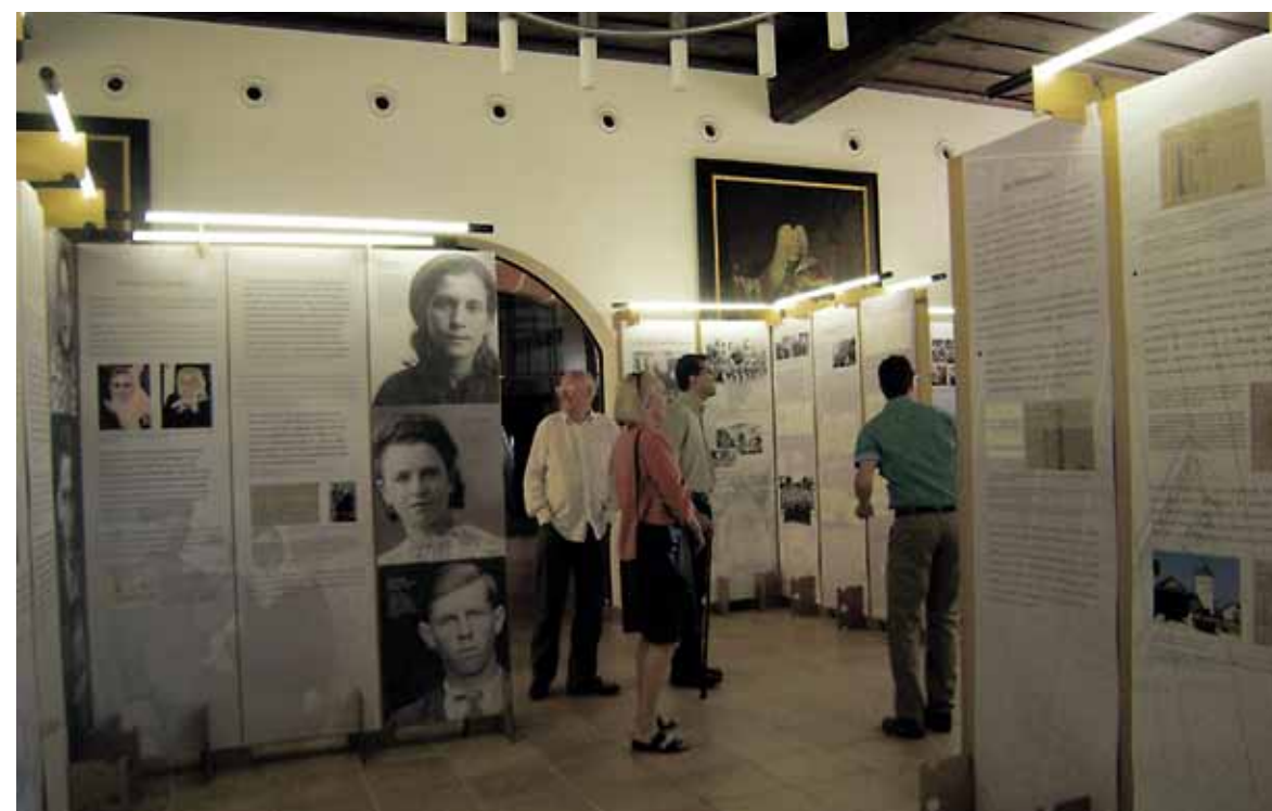
Ausstellung im Rathaussaal: Sulzbach-Rosenberg erinnert an NS-Zwangsarbeit

Seit vier Jahren gibt es in Sulzbach-Rosenberg eine Plattform gegen Rassismus und Menschenfeindlichkeit, der SPD-Stadträte ebenso angehören wie die oftmals ausgegrenzte Antifa-